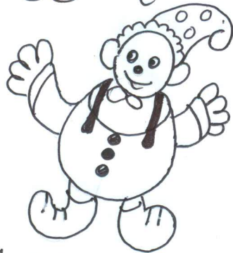
A රූපය: : මුදුරුසය භෞත

08) A රූපයේ භෞත ආකාරයට, භෞත සෑහත් ජීවර මස් මේ මුල් රූකඩයක් සකස්න්න.