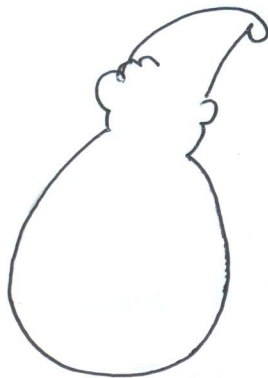
① රූප සටහන

1. ජීවර: භෞත සෑහත් ආකාරයට මෙ කැබලි රූකඩ පැඩ යක හැසන් කදන්, දෙයන්, දෙපා වෙන්කර ඇද කර ගන්න. අත් හා පිදු මල A B සිදුරු මුත මගින් ඉ ක් බිදින්න.